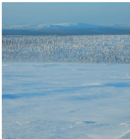
ラップランド(イメージ)