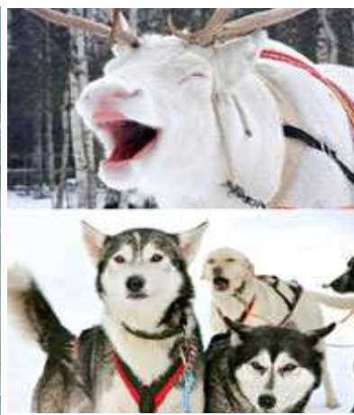
寒いですが動物は元気(イメージ)